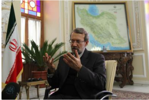
İran Meclis Başkanı Ali Laricani

İran Meclis Başkanı Ali Laricani, "Nükleer silah peşinde değiliz. Dini açıdan da onu doğru bulmuyoruz. Ayetullah'ın da dediği gibi Nükleer silah, haramdır" dedi.