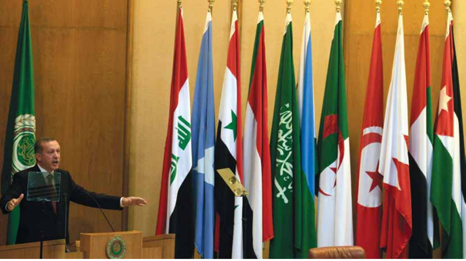
Başbakan Erdoğan, Arap Birliği Dışişleri Bakanları Konseyi'ndeki konuşmasında, Arap halkının demokrasi talebinin hukuk ve demokrasi yoluyla karşılanması gerektiğinin altını çizdi.

den kaynaklanan nedenlerle İsrail'le ilişkilerini değiştirmek zorunda kalacağını ileri sürmektedir. Diğer yandan Levy, ilişkilerde yaşanan krizin temel nedeninin de Türkiye'de bazı kesimler tarafından ileri sürülenden farklı olarak ideolojik olmadığını ve İsraililerin Gazze Savaşı ile başlayarak uyguladığı kibirli ve saldırgan politikalarının bir sonucu olduğunu belirtmektedir. Gazze Savaşında sivil Filistinlilere karşı gerçekleştirilen saldırıların İsrail karşıtlığını güçlendirdiğini, ardından Mavi Marmara ve Sina Yarımadası'ndaki saldırıların ardından İsrail yönetiminin ilişkileri düzeltmek yerine resmi özur ve tazminat karşıtı bir tutum takınarak İsrail'in güvenliğini tehdit altına soktuğunu ve dolayısıyla böyle bir diplomatik fiyaskonun ardından sorumluların cezalandırılmasını gündeme taşımıştır. 13