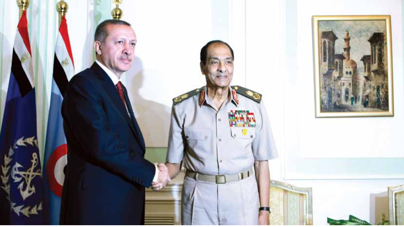
Başbakan Erdoğan, Mısır yönetimini zor durumda bırakmamak için Gazze ziyaretini erteledi. Erdoğan, Kahire'de Askeri Konsey Başkanı Hüseyin Tantavi ile görüştü.

olmasa gerek. Bilindiği üzere 18 Ağustos'ta Sina Yarımadası'nda İsraililer tarafından gerçekleştirilen saldırılar sırasında 6 Mısır askeri yaşamını yitirmişti. İsrail, Mavi Marmara olayında olduğu gibi resmi özür dilemeye yanaşmamış ve kurulmak istenen araştırma komisyonuna tam anlamıyla destek vermemiştir. 10 Eylül günü İsrail saldırısı sırasında yaralanan güvenlik personelinin de yaşamını yitirdiği gün Mısır halkı da İsrail Büyükelçiliği'ne saldırıda bulunmuş ve Kahire'de en sık korunan binaya girmeyi başararak İsrail Büyükelçiliği'ne ait olan tüm resmi evrakı Kahire sokaklarına dökmüştür. 3 Tüm bu gelişmeler karşısında halkın tepkisini daha fazla üzerine çekmek istemeyen Mısır Başbakanı istifasını sunarken, Giza Valisi Ali Abdülrahman da İsrail Büyükelçiliği'nin bulunduğu binanın korunması için yeni bir duvar inşa etmeyeceğini açıklamak zorunda kalmıştır. 4