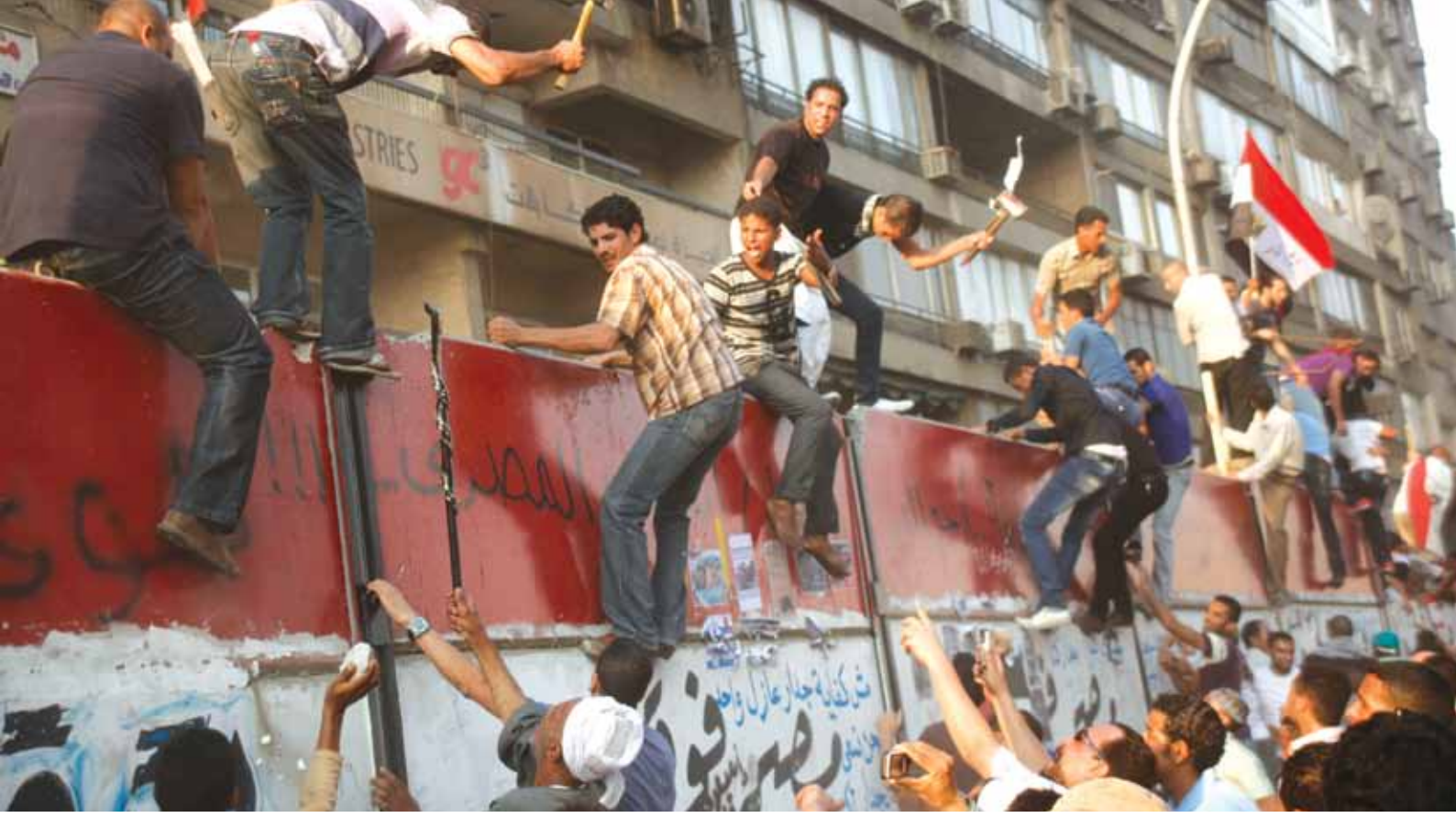
Mısır halkı, Erdoğan'ın ziyaretinden hemen önce Kahire'deki İsrail büyükelçiliğini tahrip etti.

raber çekelim. Gelin, Filistin bayrağını göndere çekelim ve o bayrak Ortadoğu'da barışın, adaletin sembolü olsun. Gelin, Ortadoğu'ya hak ettiği barış ve istikrarın gelmesine katkıda bulunalım” ifadelerini kullanarak BM Güvenlik Konseyi'nde Filistin'in tanınmasına karşı olduğunu açıklayan ABD'yi üstü kapalı bir şekilde eleştirmiştir. Böylelikle Erdoğan Washington yönetimini oldukça zor bir kararla karşı karşıya bırakmıştır. Şayet ABD Güvenlik Konseyi'nde tek başına Filistin'in tanınmasına karşı oy kullanırsa, bu durum doğal olarak Obama yönetiminin tüm Arap coğrafyasındaki kredibilitesini muazzam şekilde olumsuz etkileyecektir. Aynı durum Fransa veya bir başka devlet için de geçerlidir. Böyle bir durumda olumsuz oy kullanan devletlerin değişim süreci içinde olan ülkelerdeki etkisi sınırlanacaktır. Dahası böyle bir karar alınması, Mısır, Tunus, Libya veya Suriye'deki muhaliflerin ve yeni yönetimlerin ABD ile açık bir işbirliği yapmasını zorlaştıracaktır. Nitekim, El Faysal'ın da belirttiği gibi “Amerika Birleşik Devletleri'nin, bu ay Birleşmiş Milletler'de oylanacak olan bağımsız Filistin Devleti kararını desteklemesi gerekir; ya da Arap