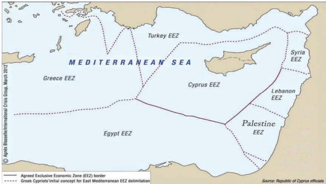
خريطة رقم (1) الحدود البحرية شرق المتوسط قبل توقيع مذكرة التفاهم التركية-الليبية

تشير الخرائط التي نتجت عن توقيع مذكرة التفاهم الخاصة بتحديد مجالات الصلاحية البحرية في البحر الأبيض المتوسط إلى تغيير واضح وكبير في الخرائط الخاصة بالأطراف الأخرى في الحوض الشرقي للمتوسط، الأمر الذي أحدث تغييراً واضحاً في تصورات العديد من دول الحوض الشرقي للمتوسط.