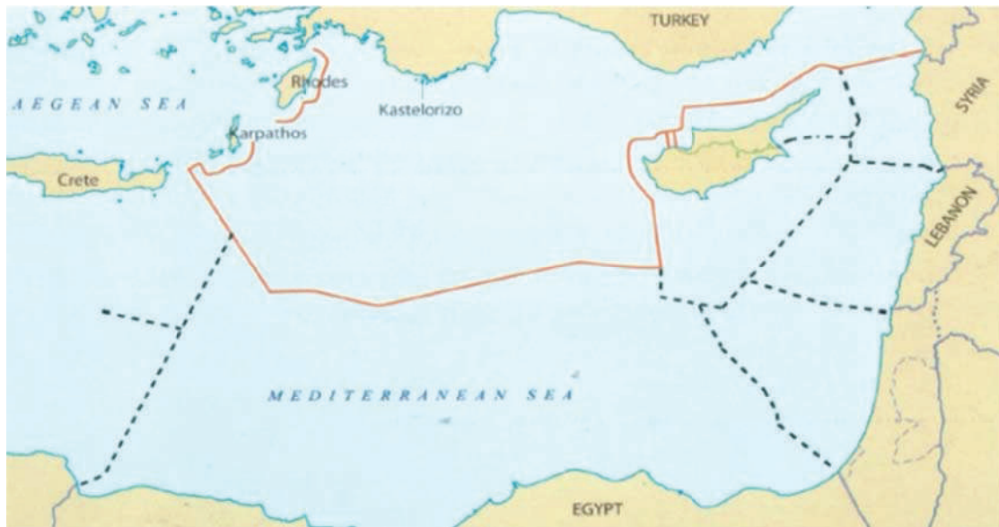
خريطة رقم (2) الحدود البحرية الجديدة لتركيا بعد توقيع مذكرة التفاهم مع ليبيا