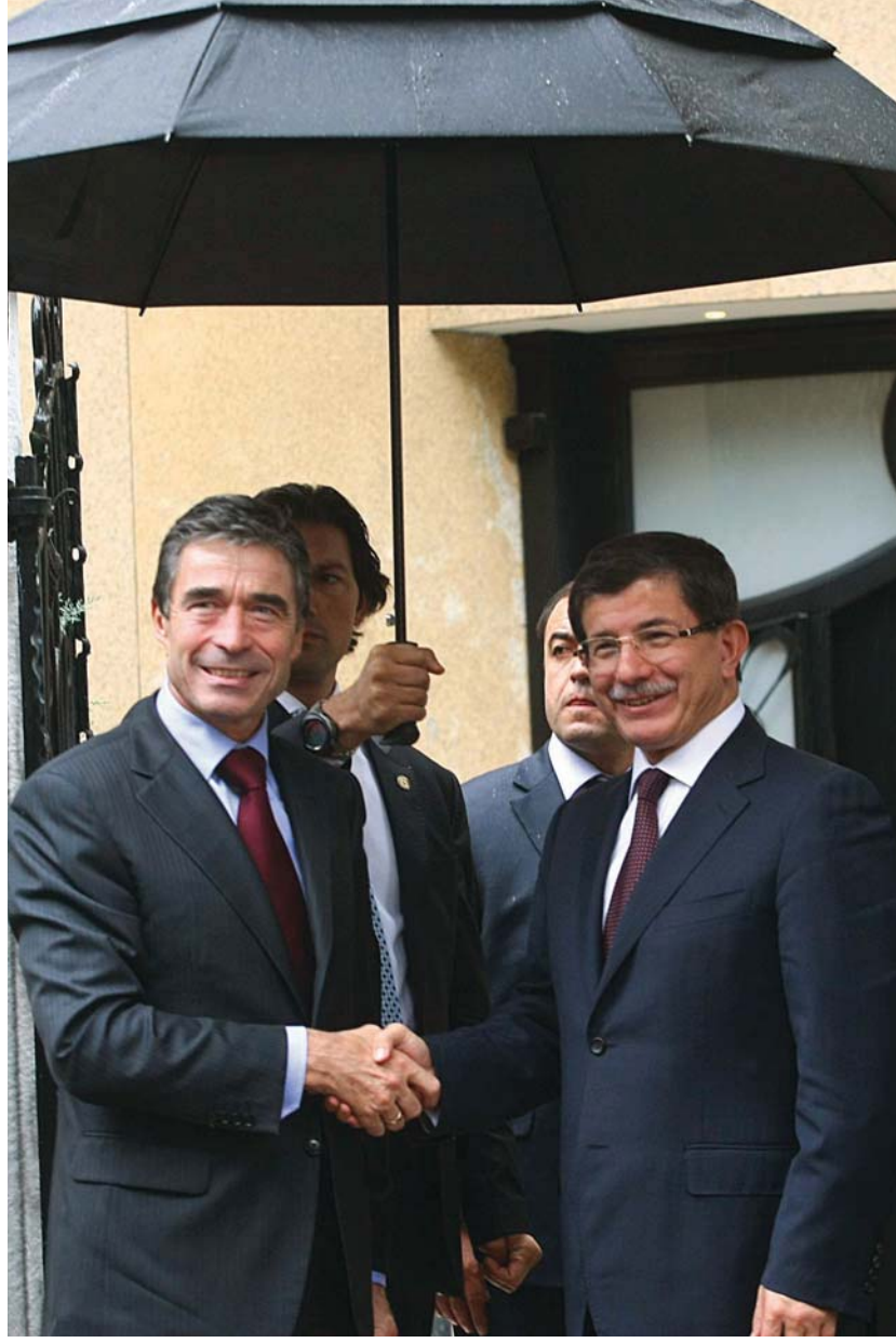
NATO Genel Sekreteri Rasmussen Türkiye ve ŞİÖ arasında güçlendirilecek ilişkilerin iki örgüt arasındaki muhtemel sorunlarda oynayabileceği köprü rolünü teyit etmiştir.

Türk dış politikasında Avrasya yönelimi ile ilgili değerlendirmeler yaparken bu yönelimin jeopolitik olarak daima Avrupa ve özellikle de AB üyeliği boyutuyla birlikte ele alınması gerektiği akıldan çıkarılmamalıdır. Zira Avrasyacılığın alternatif bir jeopolitik proje olarak 1990'ların sonunda Türk dış politikasının gündemine girişi bile esasen Türkiye'nin o dönemde AB genişleme sürecinin dışında bırakılmasına karşı yükselen tepki sayesinde mümkün olmuştur. Bu açıdan AB'nin en baştan beri Türkiye'deki Avrasya algısının şekillenmesi bakımından "belirgin öteki" işlevi gördüğünü söylemek mümkündür. Türkiye-