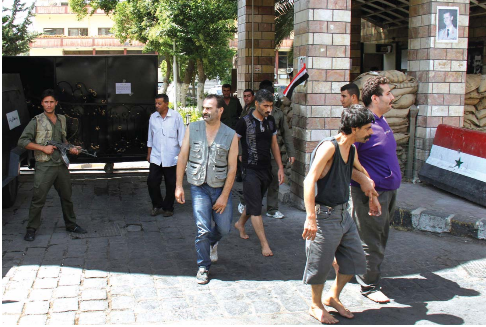
Hükümette küçük bir revizyon gerçekleştiren Esad, ülke genelinde genel af ilan etti. Ancak çatışmalarda rol alan muhalifleri, bu aftan muaf tuttu.

etti. Ancak çatışmalarda rol alan muhalifleri, bu aftan muaf tuttu.