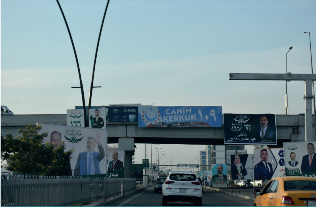
Kerkük'te 18 yıl sonra yapılacak yerel seçim öncesi etnik bileşenler arasındaki rekabet kızışıyor.

Türkiye'ye yakın olmak istedikleri yönünde yorumlanabilir. Bu durumda ITC'nin, özellikle Kerkük vilayet meclisi seçimlerinde fazla sandalye kazanabilmesi için Şii Türkmenlerin oylarına da ihtiyacı vardır. Dolayısıyla ITC'nin il meclisi seçimlerinde BITC listesinde yer alan ve söz konusu partilere yakın olan adayları değerlendirmesi önemlidir. Türkmenlerin Irak genelinde birleşmeleri sadece seçim sürecinde olmamalıdır. Dolayısıyla (BITC) koalisyonu başarısı için seçim sonrası süreçte de Türkmenlerin bütünlüğünü korumak, Türkmenler adına alınacak idari pozisyonlar konusunda da önemlidir.