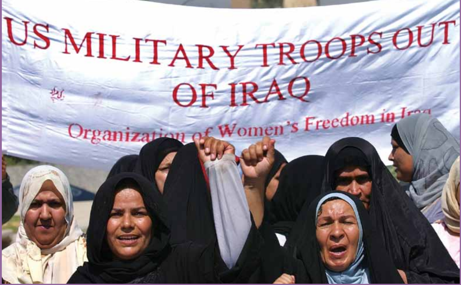
ABD güçlerinin çekilmesinin kısa ve orta vadede Irak içindeki eski tehditlerin canlanmasına neden olup iç güvenliği zayıflatması bekleniyor.

Irak'ta ABD ordusunun yerini Dışişleri Bakanlığı alıyor gibi görünmektedir. Başkent Bağdat'taki devasa kompleksin yanı sıra Erbil, Musul, Kerkük ve Basra'ya açılan yeni konsolosluklar aracılığıyla ABD Irak'taki siyasete ilgisiz kalmayacağını açıkça göstermektedir. Ayrıca sadece bu dışişleri personelini korumak için bile 7000 ABD'li özel güvenlikçi ülkede kalacaktır. Öte yandan, eğer yeni bir hükümet kurulup ABD ile Irak arasındaki güvenlik anlaşması yenilenmezse ABD'nin Irak'taki askeri varlığı 2011 sonunda sona erecektir. Fakat, başta tartışmalı bölgeler olmak üzere ülke her an yeni bir şiddet dalgasına sürüklenebilir. Irak'ın genelkurmay başkanının bile 2020 yılından önce tam hazır olamayacaklarını