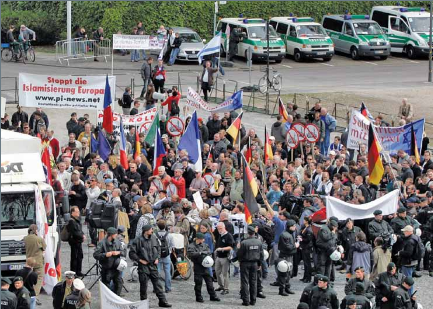
Avrupalıların İslam dünyasının gelişiminden duydukları korku, Müslüman toplumlarda yaşanan değişimi görmelerine engel oluyor.

küreselleşmenin ürünü. Dinsel gerilimler sadece geleneksel kültürlerdeki krizlere işaret eder, bu kültürlerin ürünü değildir.” 2