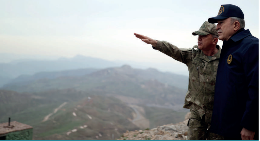
Milli Savunma Bakanı Hulusi Akar'ın sınırın sıfır noktasındaki ziyaretine dair paylaşılan görüntü.

operasyonlarının çoğu Irak'ta yapılmaktadır. Bu durum doğrultusunda 2021 yılında Türkiye'de yaklaşık 20 operasyon yapılmasına karşılık Irak'ta 200'e yakın operasyon yapılmıştır. Zira bu durumun temelinde 2017 yılı itibarıyla SİHA'ların daha etkili kullanılmasının yattığı söylenebilir.