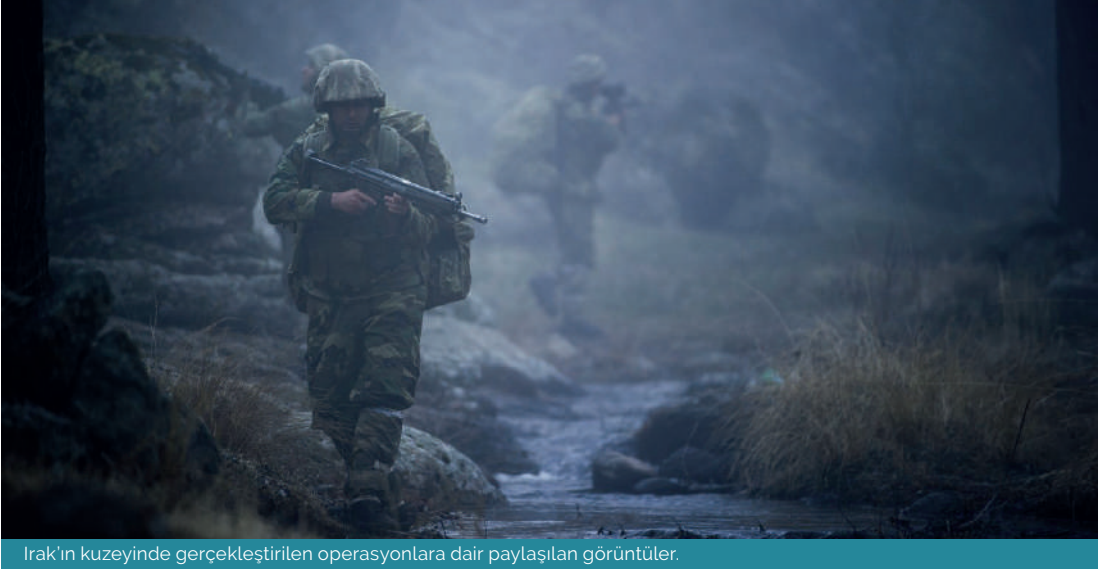
Irak'ın kuzeyinde gerçekleştirilen operasyonlara dair paylaşılan görüntüler.

Nisan 2022'de İngiltere'ye bir ziyaret düzenleyen ve Londra merkezli düşünce kuruluşu Chatham House'da bir panele katılan Mesrur Barzani, PKK'nın IKBY idari sınırları içerisinde tehdit oluşturduğunu dile getirmiştir. 3 Türkiye ile ortak güvenlik endişelerinin olduğunu ifade eden Barzani, PKK'nın çatışmaların sona ermesi için bahaneler üretmeyi bırakarak bölgeyi terk etmesi gerektiğini vurgulamıştır. IKBY'nin terör örgütü PKK'ya karşı gösterdiği bu tutumun en önemli nedeni, Türkiye'nin operasyonları neticesinde PKK militanlarının IKBY idari sınırlarını daha fazla tehdit eder hâle gelmesidir. Irak'ın kuzeyinden daha güney bölgelere kayarak bilhassa Duhok'un güneyi ve Erbil'in kuzeyinde Peşmerge'yle karşı karşıya gelen PKK; IKBY'nin bölgedeki yönetimine ortak olmayı isteyecek önemli bir tehdit hâlini almıştır. IKBY hükümetinin PKK militanlarını kendi idari sınırlarında istememesi üze-