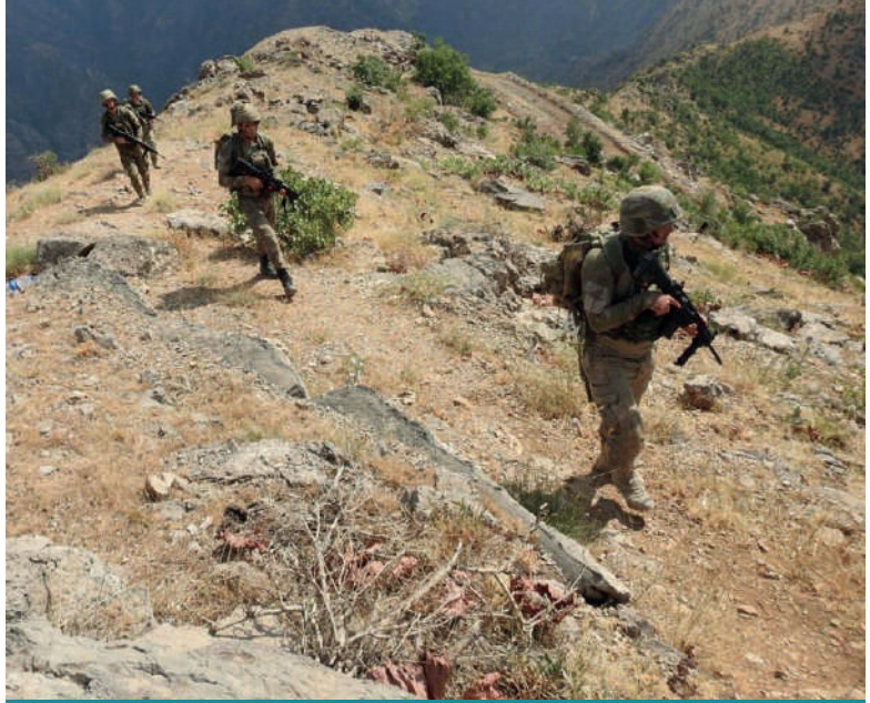
Pençe-Şimşek operasyonuna dair paylaşılan görüntüler.

Pençe Kartal 2 Operasyonu'nun ardından Pençe-Yıldırım ve Pençe-Şimşek Operasyonları eş zamanlı olarak 24 Nisan 2021 tarihinde başlatılmıştır. Bu operasyonda etki alanı Haftanın-Zap hattına göre genişletilmiş ve Haftanın-Avaşın şeridinden güneyde Gara seviyesine kadar ulaşan bir alan hedef alınmıştır.